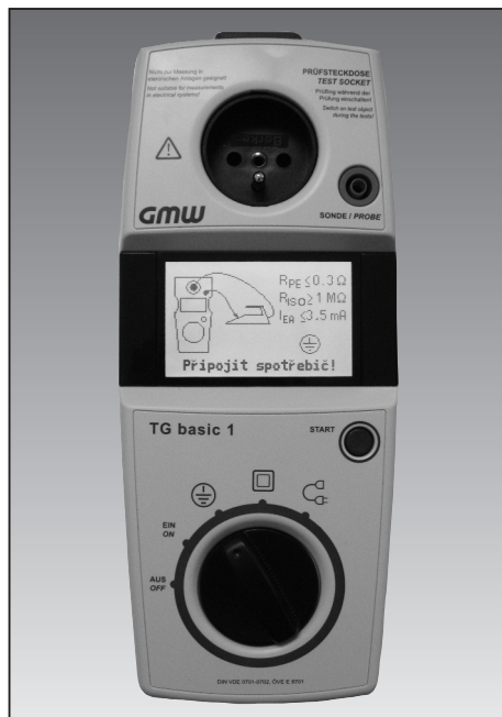
TG basic 1