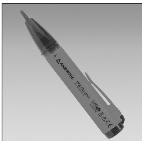
VP-450-E (VOLTfix plus)