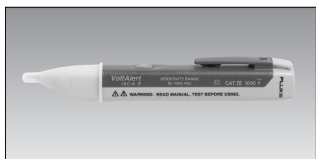
Fluke 1 AC VoltAlert