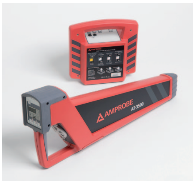
Obr. 2 Lokátor AT-3500

Kabelové rozvody, umístěné pod zemí, představují velkou výzvu pro elektrikáře, kteří potřebují tyto kabely vyhledat nebo lokalizovat místo jejich poruchy. Podzemní kabely představují velké nebezpečí při výkopových pracích. Nesprávně provedené výkopové práce, bez předchozí lokalizace kabelu, může způsobit nejen jeho poškození, ale může také vážně ohrozit zdraví pracovníků. Výsledkem jsou zvýšené náklady na opravy, případně následné finanční sankce. Měřicí přístroje firmy AMPROBE, lokátory kabelů pod zemí AT-3500 a AT-5000 jsou rychlejší a přesnější než přístroje, které jsou na trhu k dispozici v současné době. Moderní technologie a výkonný software přístroje AT-5000 nabízí několik nových funkcí a stanovuje tak nový standard při lokalizaci a vyhledávání závad v podzemních systémech. Velmi citlivá indikace vzdálenosti a směru (levá x pravá) umožňuje uživateli přesně identifikovat umístění kabelu a tím šetřit čas a náklady. Přitom není třeba při vyhledávání vyvinout takové úsilí, jako je tomu u standardních lokátorů. Vynikající selekce signálu trasovaného kabelu oproti blízkým sousedním kabelům a různým parazitním signálům udržuje pracovníka stále ve správném směru. Jádrem lokátoru AT-5000 je ergonomicky tvarovaný ruční přijímač. Jeho konstrukce je navržena pro maximální pohodlí uživatele. Je lehký a vyvážený, a proto velmi vhodný pro celodenní použití. Přijímač je vybavený jasným barevným dis-