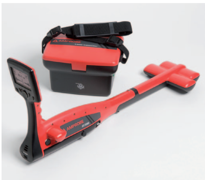
Obr. 1 Lokátor AT-5000