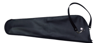
Transportní pouzdro s popruhem