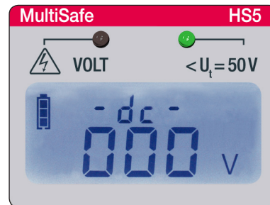
Modré podsvícení bez napětí