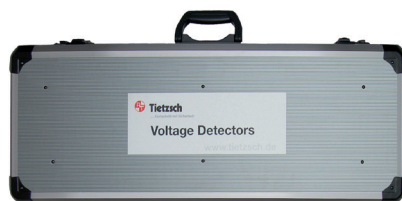
Kufrík s hliníkovým rámem