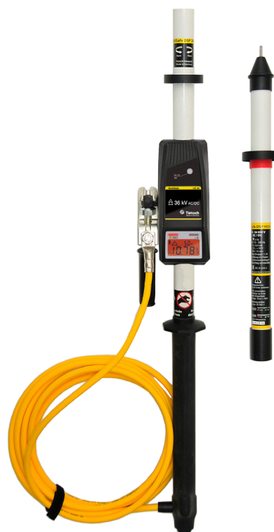
Kompaktní - lehká - rozebiratelná