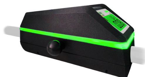
Změna barvy LED pásku 360° kolem přístroje a podsvětlení displeje v závislosti na napětí

S přístrojem MultiSafe HS 36 můžete rychle a bezpečně měřit AC a DC napětí vůči zemi až do hodnoty 36 kV.