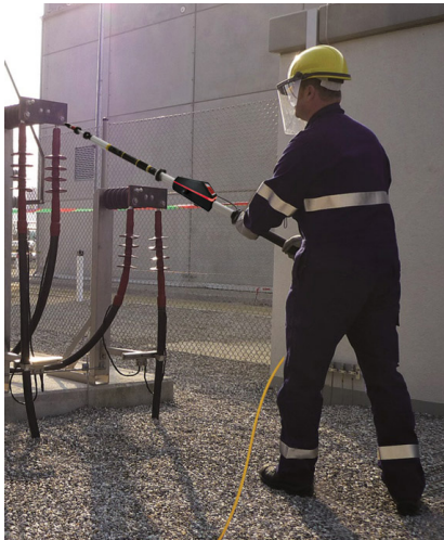
Měření se zkoušečkou HS 36 na 36 kV

MultiSafe HS 36 je dvojpólová zkoušečka pro stejnosměrná a střídavá napětí až do 36 kV vůči zemi.