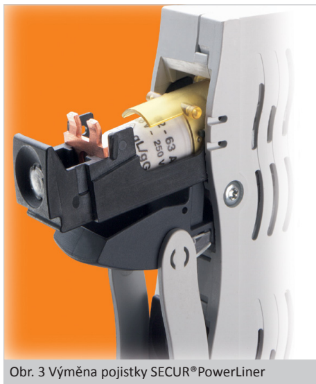
Obr. 3 Výměna pojistky SECUR®PowerLiner

Další informace o produktech společnosti Wöhner, kterou na českém a slovenském trhu zastupuje firma GHV Trading, spol. s r.o., lze získat na internetových stránkách www.ghvtrading.cz .