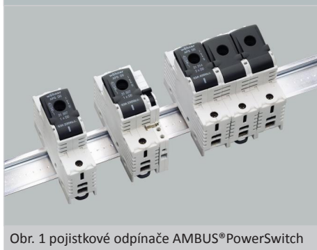
Obr. 1 pojistkové odpínače AMBUS®PowerSwitch