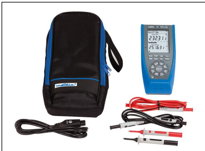
MTX 3291 – obsah dodávky