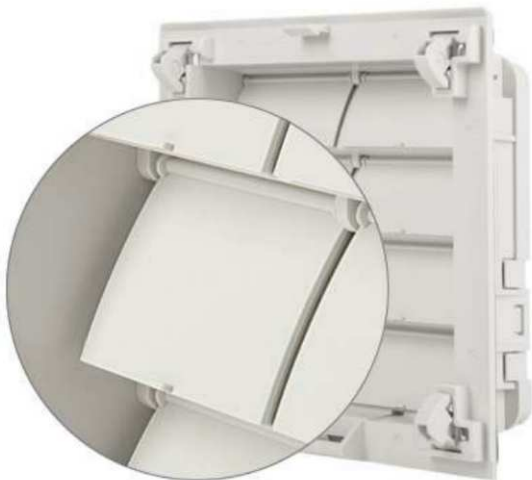
Obr. 2 Detail klapek FPI 118

nějšího chlazení a zároveň brání přístupu nečistot nebo stříkající vodě do vnitřního prostoru skříně. Nedílnou výhodou je také rychlá instalace pomocí „rohatek“, které zajišťují vysokou těsnost. Použitím pouze jedné filtrační vložky na výstupní mřížce se snižují náklady na údržbu.