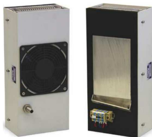
Obr. 7 Odvlhčovací zařízení

Kromě chladících jednotek je sortiment rozšířen o odvlhčovací zařízení (obr. 7), které umožňuje řízené odvádění vlhkosti z prostoru skříně s elektronikou. Využití tohoto zařízení je především v oblastech s velmi