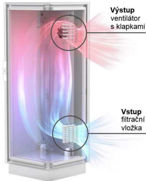
Obr. 3 Směr proudění „VEN“ - FPO

Velkou výhodou zařízení s Peltierovým článkem je absence chladicích kapalin.