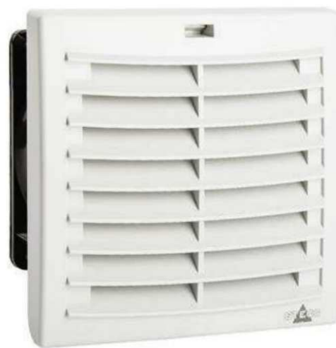
Obr. 1 Ventilátor s filtrem PLUS