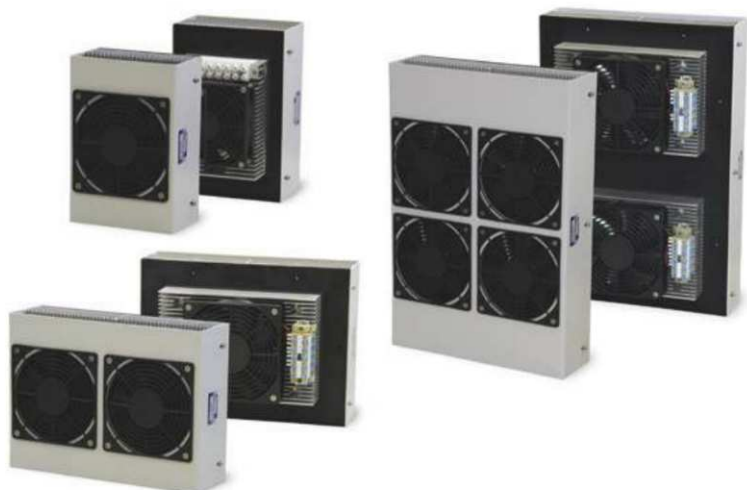
Obr. 5 Chladicí zařízení Peltier

Jednotky Peltier jsou rozděleny do kategorií podle velikosti, příkonu a napájecího napětí. K ochraně před přehřátím jsou jednotky vybaveny teplotním kontaktem, upozorňujícím obsluhu na dosažení rizikové teploty 80 °C a také teplotní ochranou, která při dosažení 90°C vypíná zařízení a zabraňuje tak případnému poškození.