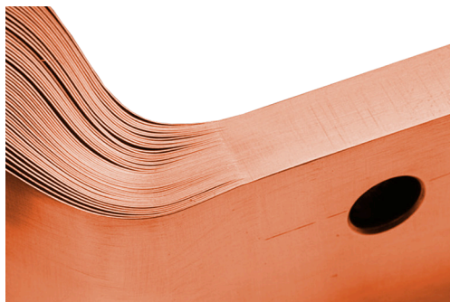
Obr. 1 Svařovaná lamelová spojka