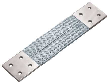
Obr. 3 Spojky ze splétaných pásků z pocínované mědi