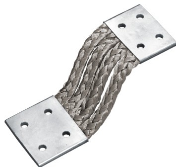
Obr. 4 Spojka ze splétaných lanek z pocínované mědi

Spojky lze dodávat i s izolací na pletenci. Podle požadovaných vlastností je možné vybírat z široké škály izolací mezi které patří například gumová nebo sklolaminátová. V případě použití izolace je nutné brát v úvahu omezení chlazení spojky, což má za následek snížení proudové zatížitelnosti o cca 15 – 20%.