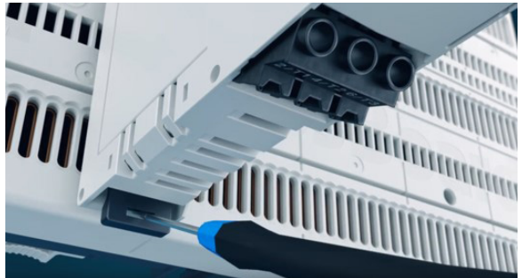
Obr. 4 Demontáž komponent z CrossBoardu