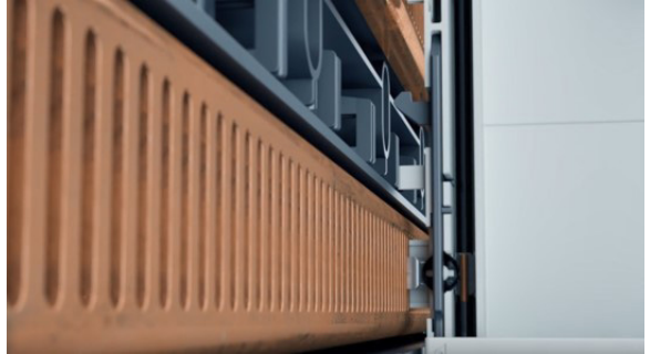
Obr. 2 Zaklapnutí komponent na CrossBoard