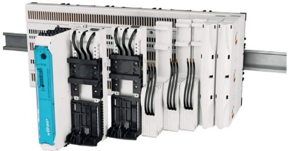
Obr. 3 Osazení CrossBoardu přípojnými komponenty