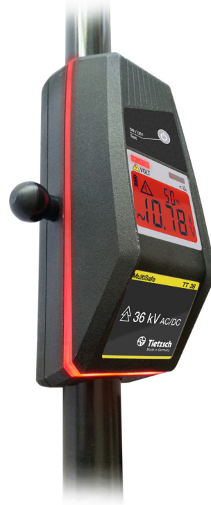
Změna barvy LED pásku 360° kolem přístroje a podsvětlení displeje v závislosti na napětí (zelená/červená)

MultiSafe TT 36 je zkoušečka napětí pro rychlé a bezpečné měření na vysokonapěťových systémech do 36 kV. Společně s napětím je na dvojřádkovém displeji zobrazena i hodnota frekvence napětí.