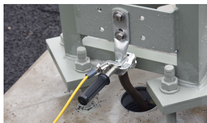
MultiSafe TT 36UK Univerzální uzemňovací svorka

Možnost připojení i pomocí magnetu nebo speciální kolejové svorky