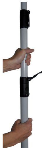
Plynulé nastavení délky