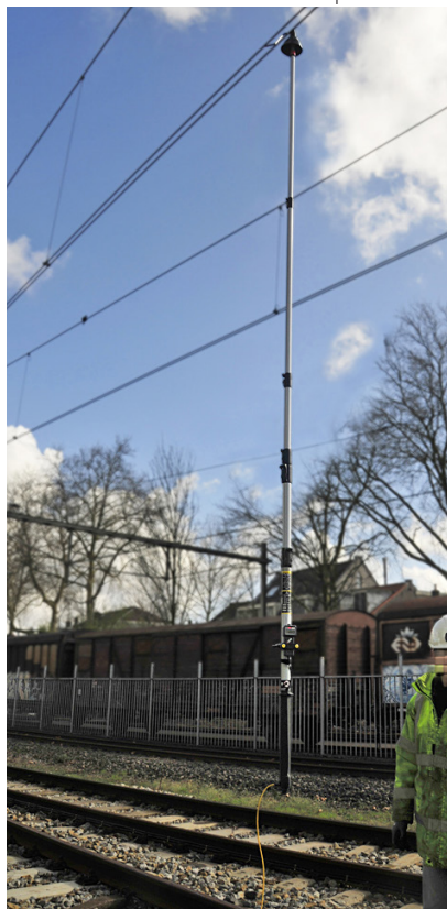
Měření na drážních systémech