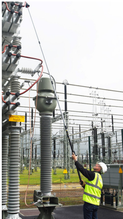
Měření na 36 kV zařízení

MultiSafe TT 36 je teleskopická vysokonapěťová dvoupólová zkoušečka pro střídavá a stejnosměrná napětí až do 36 000 V. Díky své teleskopické konstrukci je určena zejména pro měření na trolejích drážních systémů, venkovních vedeních nebo na rozváděcích.