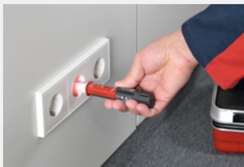
Test přítomnosti AC napětí a test polarity na zásuvkách