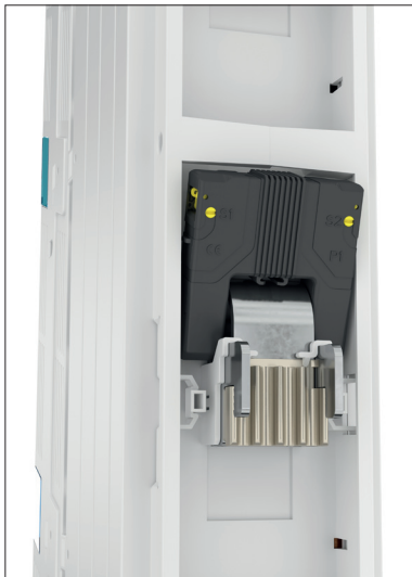
Obr. 2. Umístění transformátoru v odpínači

dostupné na většinu „deonů“ a lištové odpínače pojistek NH. Ochrana proti dotyku je zachována díky krytům CrossLink®, které však nezabraňují montáži jednotlivých prvků. Pružinové odpínače s pojistkami NH v základní nebo verzi „Speed“ zajišťují snadné, bezpečné a rychlé odpojení elektrického okruhu bez nutnosti použití dalších nástrojů. Z odpínačů lze odvést napětí dolů (standard) i nahoru. Stav pojistek lze sledovat i na dálku pomocí elektronických ukazatelů. Jedním z nejzajímavějších prvků systému je možnost měření proudu v jednotlivých fázích na adaptérech EQUES i v odpínačích bez nároku na další prostor na přípojnících.