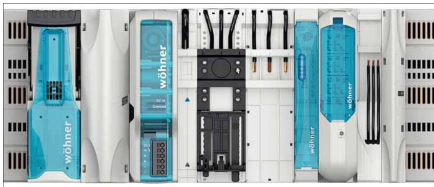
Obr. 1. Systém Crossboard

První z adaptérů s označením 32277.000 a 32278.000 umožňují snadnou montáž již zmíněných prvků Crossboard na systém 185Power. Vodiče z prvků jsou pak důmyslně vedeny „tunely“ v adaptéru a tím je zaručena přehlednost a úhlednost zapojení.