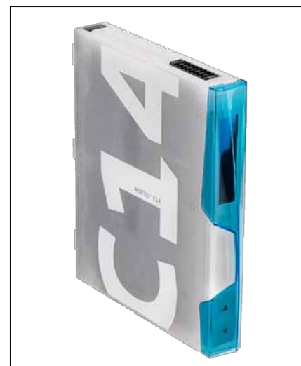
Obr. 3. Motorový spouštěč Motus C14

Nejnovějším přírůstkem do rodiny produktů Wöhner je inteligentní motorový spouštěč Motus C14 dodávaný pro všechny zavedené systémy Wöhner, tedy Crossboard, 30Compact a 60Classic. S použitím výše zmíněných adaptérů jej lze namontovat i na systém 185Power.