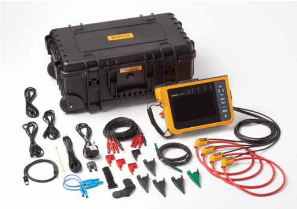
Analyzátor kvality elektrické energie Fluke 1777. Poznámka: Dodávané položky se liší podle modelu a jsou uvedeny v tabulce „Objednací informace“.