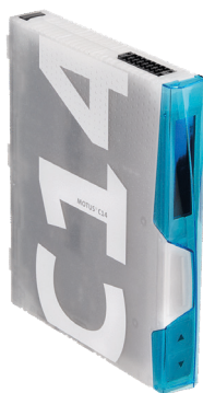
Motorový spouštěč MOTUS C14 30Compact

Verze Connect Plus je kromě barevného LED podsvícení, signalizující stav a poruchy, vybavena LCD displejem. LCD displej zobrazuje základní údaje jako směr otáčení