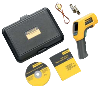
Fluke 566 a standardně dodávané příslušenství